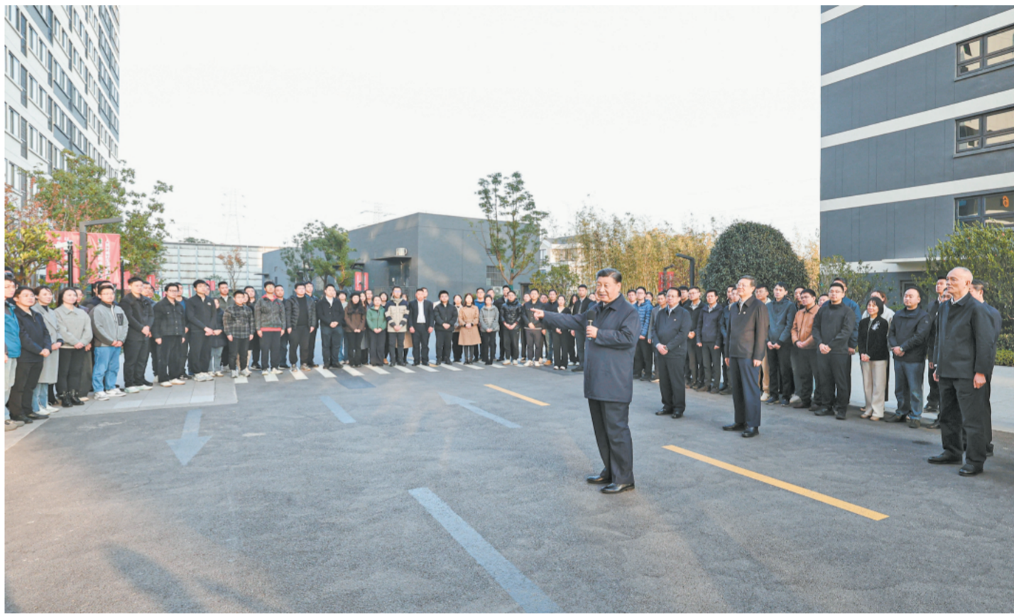
11月28日至12月2日，中共中央总书记、国家主席、中央军委主席习近平在上海考察。这是11月29日下午，习近平在闵行区新时代城市建设者管理者之家，同社区居民亲切交流。